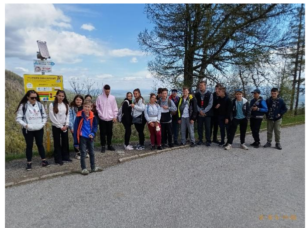
Ótátrafüreden a csapat

5. nap: Városnézésre indultunk a történelmi Magyarország leggazdagabb településén, Kassán . Látogatást tettünk Közép-Európa monumentális gótikus templomában, a Szent Erzsébet domban, melyben megtalálható Rákóczi fejedelem sírja. Itt is elhelyeztük a megemlékezés koszorúját. Megnéztük a Rodostó-házat, majd városnéző sétát tettünk, mely során érintettük az Orbán tornyot a zenélő szökőkúttal, harangjátékkal és az egykori Fekete Sas fogadót (nyelvújítónk, Kazinczy lakott itt). Megérkezésünk napján éppen ballagás volt. Megismerkedhettünk egy érdekes bolond ballagási szokással is.