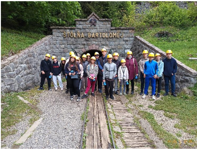
Bányalátogatás után Besztercebányán