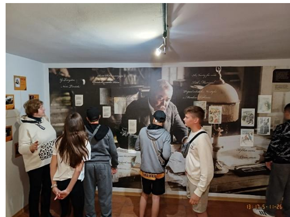
Szklabonyán a Mikszáth-házban