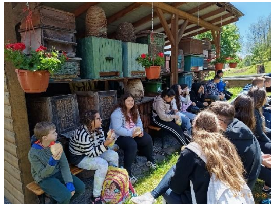
Léván a régi méhkaptárak között