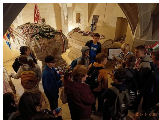
Rákóczi síremlékénél Kassán