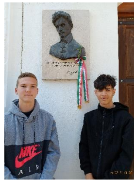
Rimaszombatban Múzsák házánál koszorúzás

4. nap: Reggeli után elutaztunk a Tátra legelegánsabb településére, Ótátrafüredre . Túrátunk a Tarajka turistaközpontba, elgyalogoltunk a híres Tar-pataki vízesések hez, melyet Csontváry festményeiről is ismerhetünk. Az egymás fölött, egymáshoz közel elhelyezkedő vízesések a zuhatagok összetett rendszerét alkotják.