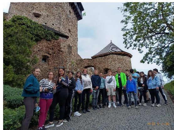
Csapat a Füleki várnál

2. nap: Az UNESCO világörökség listán szereplő festői kisvárosba, Selmecebányára utaztunk, mely egykoron Európa ezüstművészetének központja volt. Városnézés történt az Óvárosban: óvár, Szent Katalin-templom. Felkerestük Petőfi emléktábláját egykori iskolájának, a Líceumnak falán. Látogatást tettünk a Szabadtéri Bányászati Múzeumban. Városnéző sétára került sor a Felvidék legszebb főterén, Besztercebánya belvárosában.