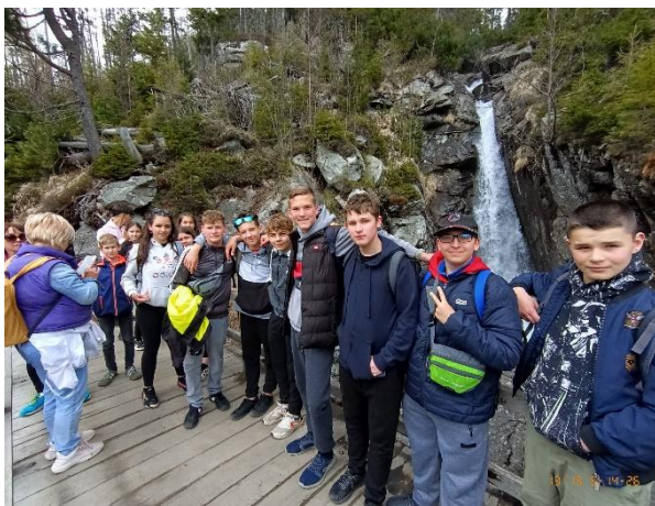
Kirándulás a Tar-pataki vízesésnél

4. nap: Reggeli után elutaztunk a Tátra legelegánsabb településére, Ótátrafüredre . Túrátunk a Tarajka turistaközpontba, elgyalogoltunk a híres Tar-pataki vízesések hez, melyet Csontváry festményeiről is ismerhetünk. Az egymás fölött, egymáshoz közel elhelyezkedő vízesések a zuhatagok összetett rendszerét alkotják.