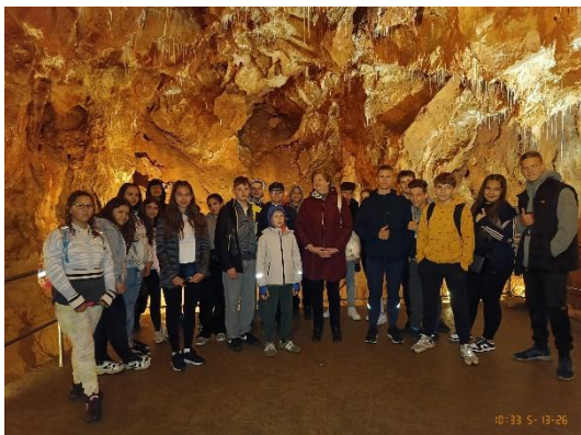
Kipróbáltuk a Gombaszögi-barlang akusztikáját

3. nap: Ellátogattunk a Szlovák Karszthegység egyik barlangjába , a Gombaszögi barlangba. Megálltunk Tornaalja melletti Léván megismerkedtünk egy helyi méhész termékeivel, kipróbáltuk a méhes házat, melyet gyógyászati céllal használnak. Megismerkedtünk Gömör vidék hagyományaival, kerámiáival. Délután városnézésre került sor Rimaszombatban : Tompa Mihály és Petőfi Sándor szobránál megálltunk, felidéztük költészetüket. Petőfi szobránál elszavaltuk a Nemzeti dalt. Elsétáltunk a Múzsák házához, Petőfi egykori szállásához. Megkoszorúztuk az ott látható Petőfi emléktáblát.